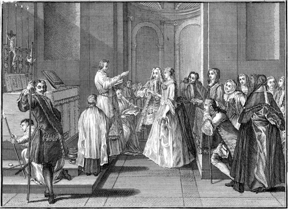
Ceremonie de MARIAGE.